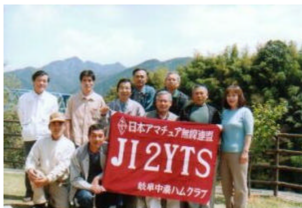
クラブ行事でのひとこまで de JI2YTS/岐阜中濃ハムクラブ