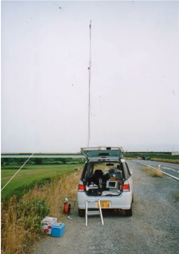
写真にある脚立に座って運用していました。 de JM1RPV/2

県内S-0p電信電話HFハイバンド (G-SHH) JM1RPV/2 初めての参加です。逆V3本だけのお手軽装備での参加でしたが、コンディションに助けられたこともあって思っていた以上に遊べました。来年も何らかの形で参加できれば...と思います。<編：以下の写真にあるようなANTでも現地乗り込みなら充分呼ばれる立場となり得る、というのを実感していただけたいですね。来年もぜひ県内局でご参加を!>