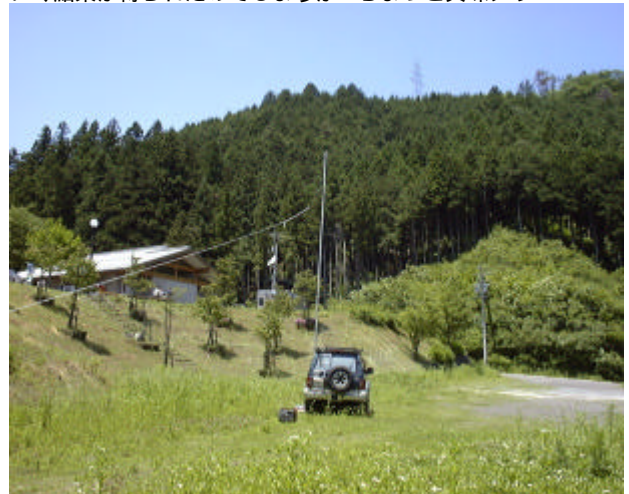
武儀郡洞戸村移動でした。 de J02JDJ/2

県内S-0p電信1.9MHzバンド (G-S1.9) JA2AUE 初日、久しぶりのコンテスト参加でリグの埃をはらって参加しました。二日目、この日は恒例の町内の勤労奉仕作業。遅れて参加。参加することに意味あり。<編: 町内とのマッチングも大切ですよ。XXK委員長も引越先での近所付き合いが大変みたいですよ> J02JDJ/2 ANTのTESTを兼ねてわずかの時間県内局ではじめて参加しました。<編: ANTの試験は納得のいく結果が得られたのでしょうか? ちょっと興味アリhi>