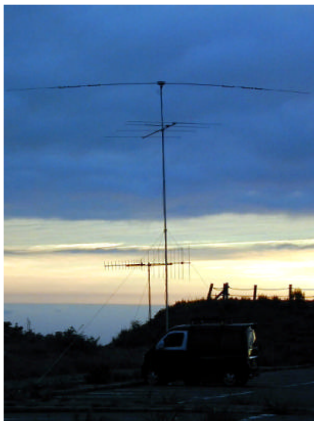
昨年8月の鳥海山移動の時の写真です。 お手軽移動の時はいつもこんな感じです！ 車の網戸はこれからの季節必需品ですね！